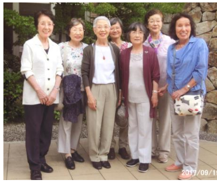
施設長と同窓生の皆様