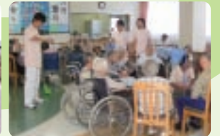
毎日異なるレクリエーションを行い、楽しんで頂きます。