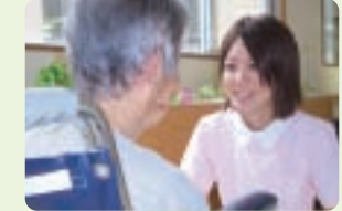
利用者様と昔の話や今の話、今不便に思っていることはないか話をして快適に過ごして頂けるようにしています。