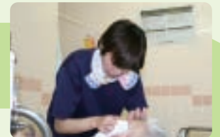
週2回、機械浴が大風呂か家庭風呂に入って頂きます。