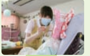
1人ひとりのペースに合わせて介助をします。